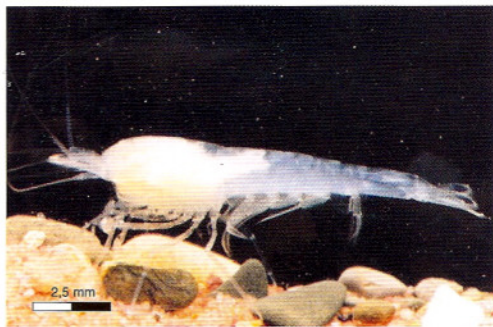
Typhlatya miravetensis , Cova del Ullal de Miravet, Cabanes, Castellón.

COMENTARIOS TAXONÓMICOS: Al igual que otros organismos estigobios, la quisquilla T. miravetensis se caracteriza por ser blanca y ciega. Forma parte de un grupo de una veintena de especies, de las cuales la mitad tienen una distribución americana y tres son europeas (España, Francia y Herzegovina). Los caracteres que distinguen la especie ibérica de las demás son los siguientes: ojos carentes de pigmentación, un rostro corto, ischium y merus de los